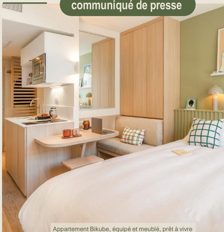
Appartement Bikube, équipé et meublé, prêt à vivre