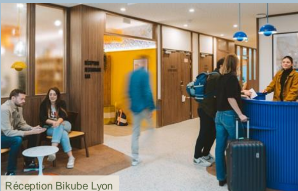
Réception Bikube Lyon

Avec de nombreuses références empruntées à la musique, au cinéma et des objets chinés qui renvoient à d'autres époques, Bikube apporte un soin tout particulier à la décoration, bien au-delà de l'ambiance classique de l'hôtellerie. Chaque étage dédié aux clients long-séjours offre un espace de coliving d'environ 100 m 2 avec cuisine et salon partagés. Comme une extension d'appartement, ils sont accessibles à toute heure et proposent 3 couleurs pour 3 univers décoratifs dans lesquels on se sent véritablement chez soi, « comme à la maison » : Green (ambiance zen), Yellow (ambiance californienne) et Pink (ambiance rock anglais).