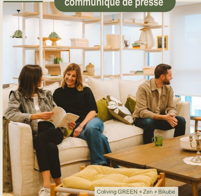
Coliving GREEN « Zen » Bikube

LE NOUVEAU LIEU DE VIE LIFESTYLE HYBRIDE QUI REDÉFINIT LE VIVRE-ENSEMBLE